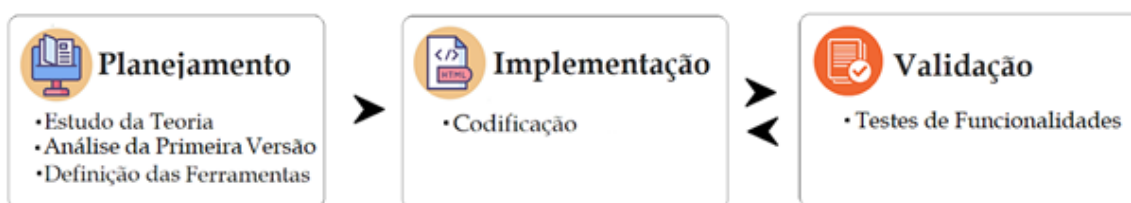
Figura 1. Fluxo das etapas desenvolvidas.

O fluxo de trabalho representado pela figura 1 exhibe as etapas seguidas para o desenvolvimento deste trabalho.