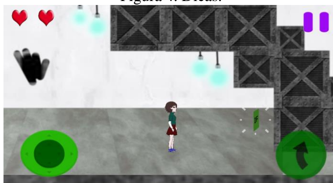
Figura 4. Dicas.

As dicas que Samantha encontra no jogo são cards contendo informações sobre os conceitos de lógica de programação, que vão ajudá-la a concluir a missão (Figura 5-A). Ao final de todo o percurso e ao responder o desafio corretamente, Samantha obterá o cartão perfurado (Figura 5-B) necessário para concluir a missão, e assim ajudar as garotas do ENIAC a fazer o computador funcionar corretamente