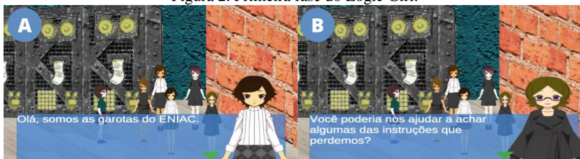
Figura 2. Primeira fase do Logic Girl.

Na primeira fase do jogo, Samantha é levada a um ambiente onde encontra as garotas responsáveis pela programação ENIAC, que irão passar as instruções para ela de como ligar o primeiro computador da época (Figura 2-A). No momento em que o(a) jogador(a) se aproxima das garotas do ENIAC, elas iniciam um diálogo com a personagem Samantha sobre as informações necessárias para dar prosseguimento no jogo (Figura 2-B). A partir dessas informações, as garotas do solicitam que a Samantha realize uma missão para ajudá-las a ligar o ENIAC.