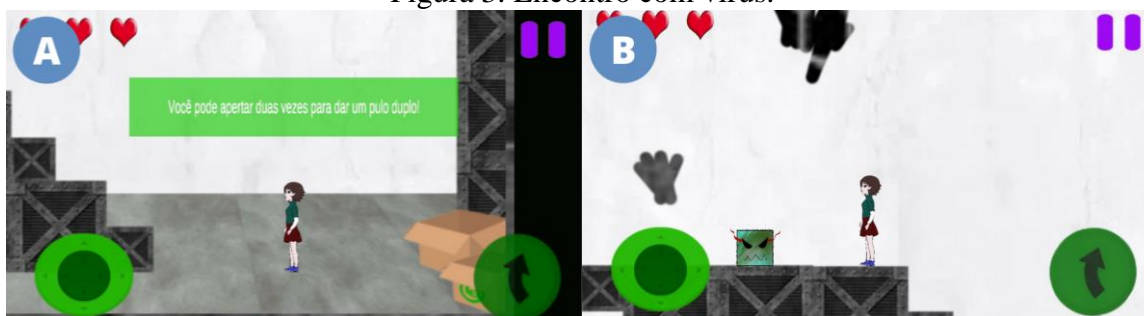
Figura 3. Encontro com vírus.

Durante a missão são disponibilizadas dicas referentes aos conceitos de lógica de programação que o(a) jogador(a) terá que utilizar para resolver os desafios presentes no jogo. Os desafios devem ser concluídos para obtenção de itens importantes, como por exemplo, no momento em que for encontrado o cartão perfurado, o item será necessário para concluir a missão passada pelas garotas do ENIAC (Figura 4).