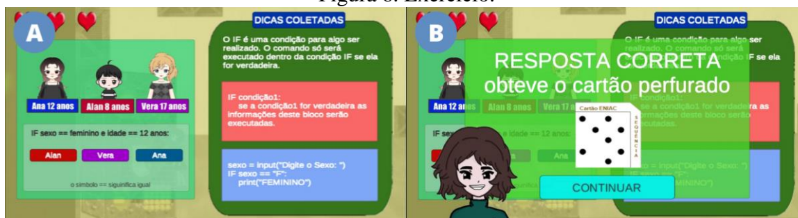
Figura 6. Exercício.

Para responder corretamente o exercício apresentado na Figura 6-A, o(a) jogador(a) poderá ler as dicas que coletou ao longo do jogo e os conteúdos abordados sobre lógica de programação clicando na opção de pausar o jogo, desse modo, poderá escolher a opção que torne a condição verdadeira, clicando no nome do personagem que satisfaça o condicional IF e ao concluir o exercício. O(a) jogador(a) recebe o cartão perfurado (Figura 6-B), o item que contém informações representadas pela presença ou falta de furos para ser utilizado na máquina ENIAC.