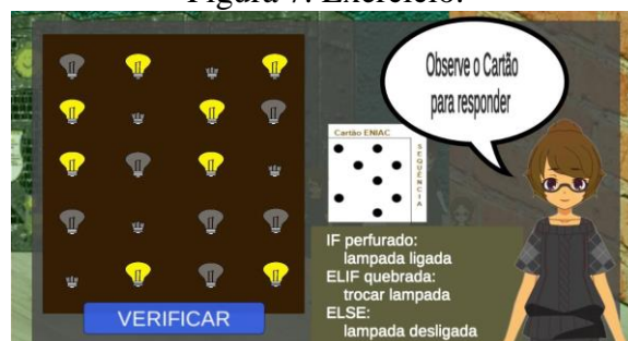
Figura 7. Exercício.

Ao voltar à sala do ENIAC, as garotas pedem a Samantha que resolva mais um exercício (Figura 7). A perfuração no cartão serve como base para o(a) jogador(a) passar as instruções para o ENIAC. Concluindo a missão que as garotas propuseram, o(a) jogador(a) é levado de volta para a sala em que o ENIAC se encontra, no qual as garotas agradecem Samantha por ajudar com os desafios envolvendo o ENIAC e geram um portal para que ela retorne ao mundo real depois de toda a sua jornada de aprendizados.