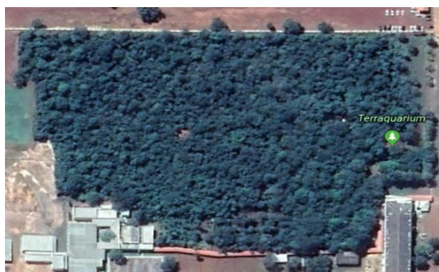
Figura 1. Localização do Terraquarium do CEULP/ULBRA, em Palmas - TO.

O estudo feito no Terraquarium do CEULP/ULBRA no município de Palmas, no Estado do Tocantins, nas coordenadas 10°16'27.173" S e 48°20'05.670" W, alcançando uma elevação de 254m. Com área de 4,15ha, que é preservada e utilizada como fonte de coleta de informações a respeito do Cerrado e cultivos agroecológicos, conforme se observa na Figura 1.