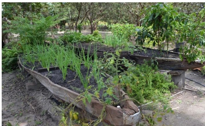
Figura 2: Cultivo de hortaliças dos torronzeiros.

De acordo com o Plano de Manejo do Parque Estadual do Cantão (TOCANTINS, 2016), os terrenos mais elevados do PEC, denominados localmente de "torrões", encontram-se nos diques marginais de rios e em áreas onde há muita deposição de sedimentos. Raramente os torrões são atingidos pelas cheias dos rios. A maior parte dos torrões no curso do rio Araguaia consistem de roças antigas, em estágios diversos de sucessão. “Nas proximidades da cidade de Caseara não existem torrões em bom estado de conservação. De fato, nesse setor do PEC, pode-se afirmar que as matas de torrão são a comunidade natural mais ameaçada” (idem, p. 30).